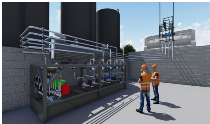
Vue 3D : Spie batignolles

Outre la gestion des ressources, le BIM permet aussi à Spie batignolles énergie d'appréhender ses chantiers avec bien plus d'efficacité et de tranquillité d'esprit. Les allers-retours entre les différents interlocuteurs sont minimisés grâce à la création d'un plan unique, dont l'élaboration limite par ailleurs les imprévus.