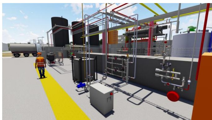
Vue 3D : Spie batignolles